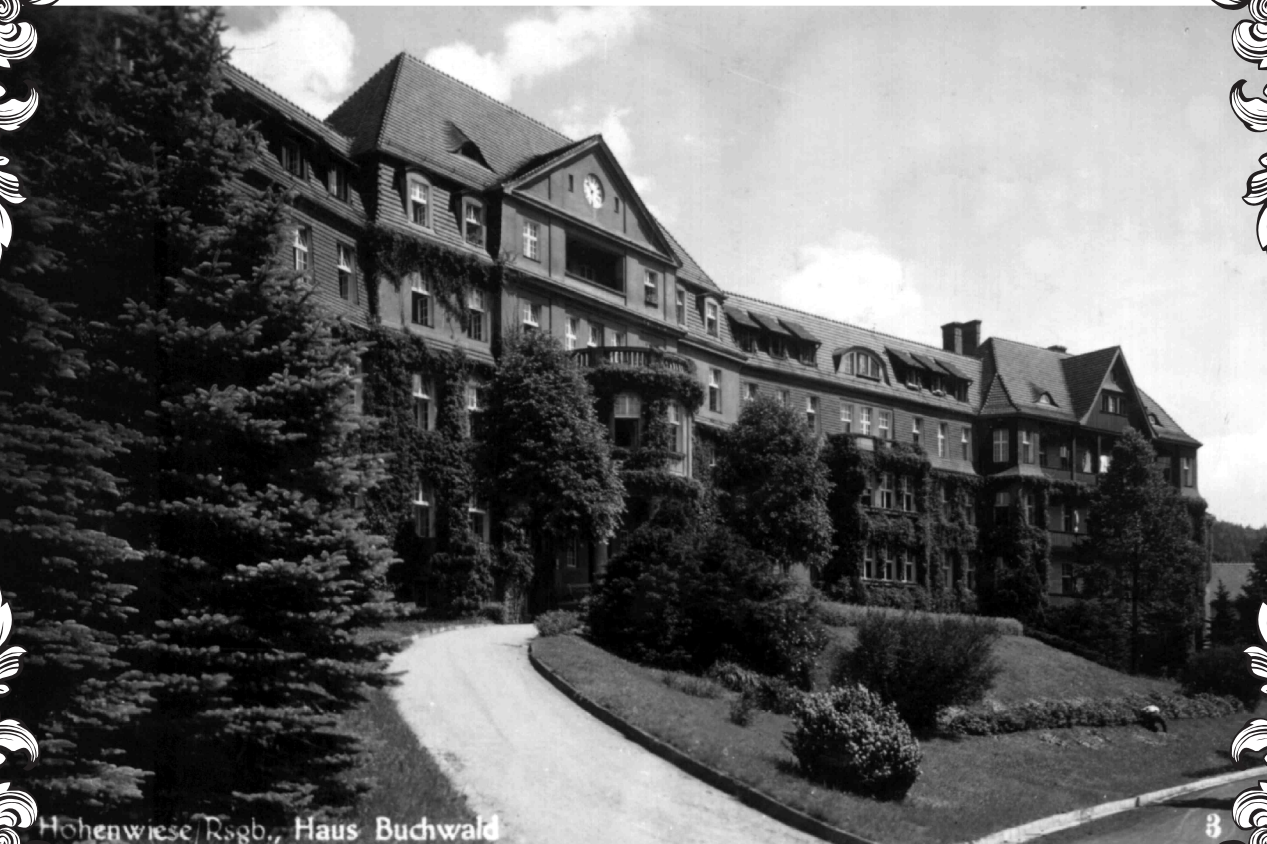
Hohenwiese/Rsgb., Haus Buchwald