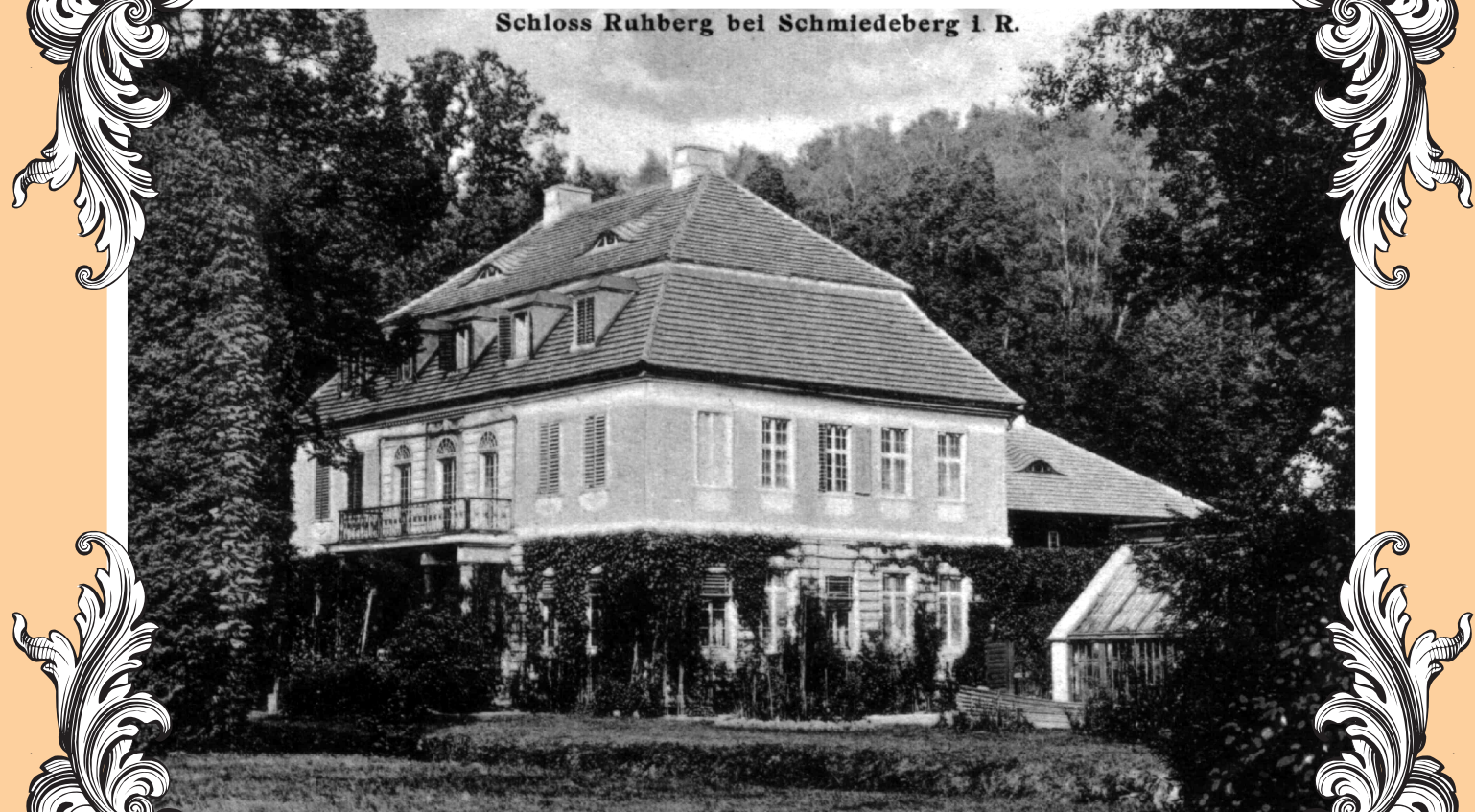
Schloss Ruhberg bei Schmiedeberg 1. R.

Miasto Kowary, pałac Ciszycy Město Kowary, zamek Ciszycy Stadt Kowary, Schloss Ruhberg Town of Kowary, Ciszycy Palace